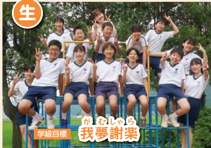
がむしゃら 我夢謝楽 学級目標