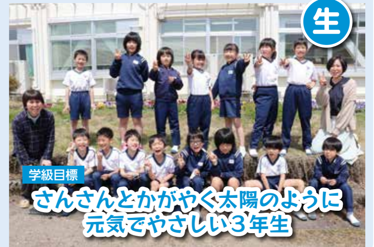
学級目標 さんさんとかがやく太陽のように元気でやさしい3年生