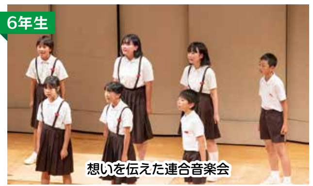
想いを伝えた連合音楽会