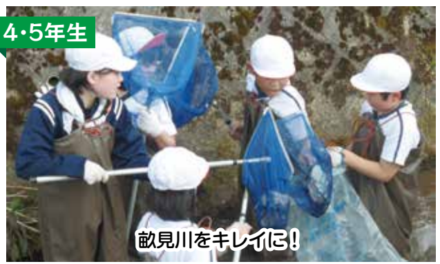
敵見川をキレイに！