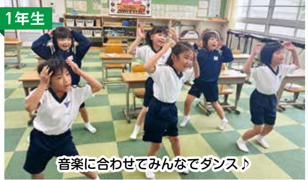
音楽に合わせてみんなでダンス♪