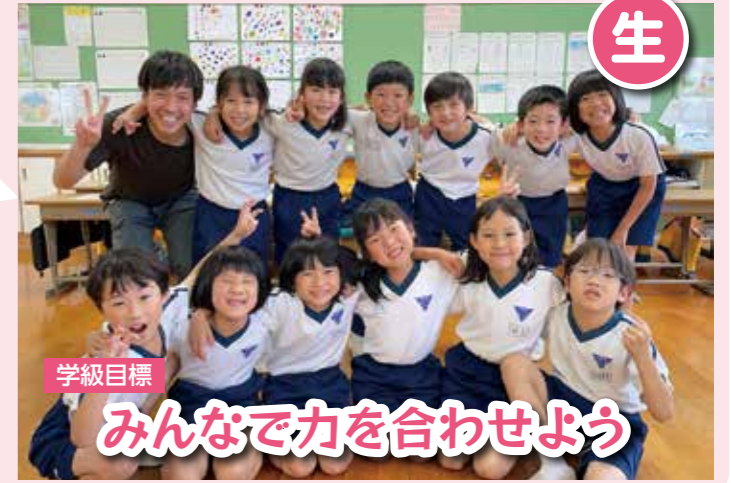
学級目標 みんなで力を合わせよう