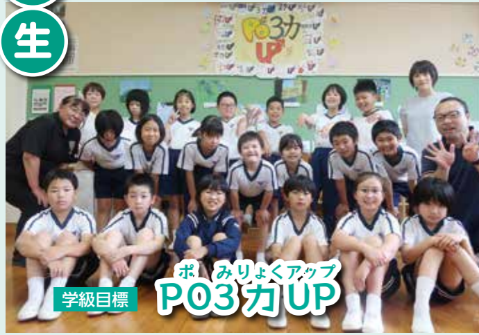
ポみりよくアップ P03カUP 学級目標