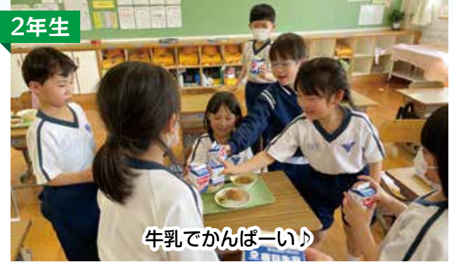
牛乳でかんぱーい♪