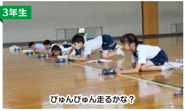
びゅんびゅん走るかな？