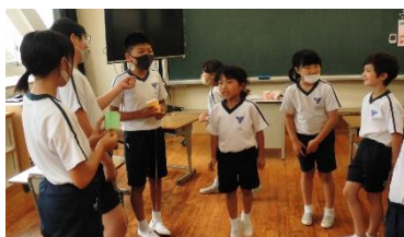
1班「Q&A」「つくえサッカー」

縦割り班で1～6年生が仲よく遊びます。それぞれの班で楽しい活動を計画し、みんな笑顔で活動ができました！！